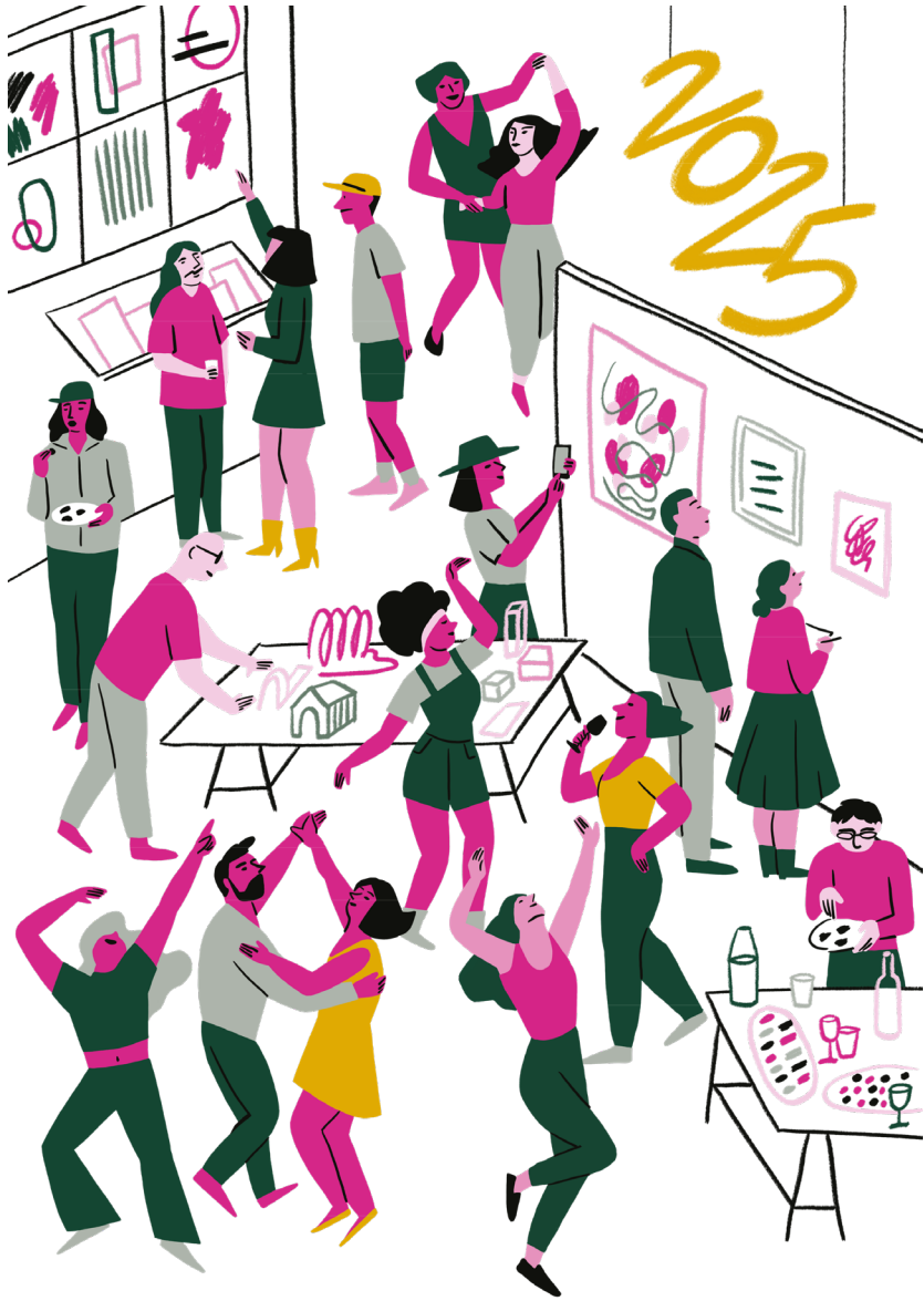
Illustration : ©Kei Lam

La grande exposition Journées portes ouvertes